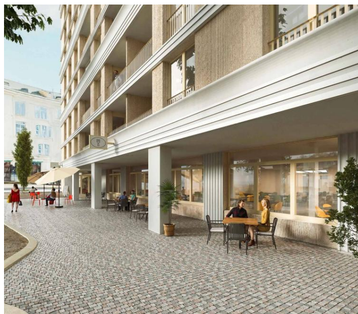
Route des Acacias